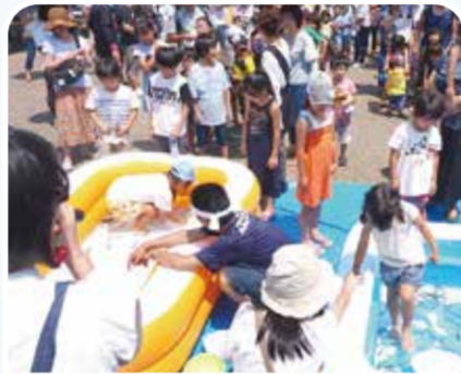
子ども どじょう掴み大会