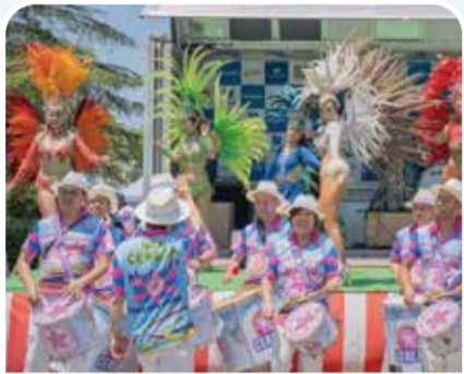
サンバカーニバル 『フロール・チ・マツド・セレージャ』