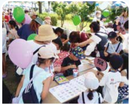
子どもわくわく イベント