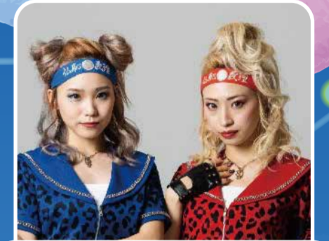
木更津発 仏恥義理アイドル C-Style